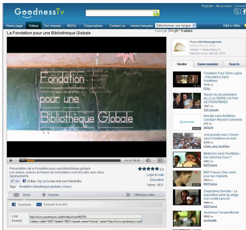
Vidéo promotionnelle de la FBG sur Goodness.tv