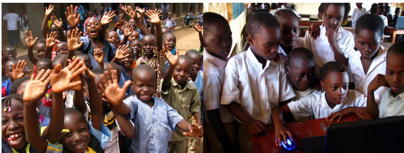
Élèves au Burkina et au Bénin

La deuxième phase réalisée en 2010 consistait à des formations sur la BNJFS aux enseignants et directeurs d'écoles dans quatre pays : Burkina Faso, Bénin, Mali et Sénégal. Les ministères de l'éducation des quatre pays ont été impliqués dans cette mission.