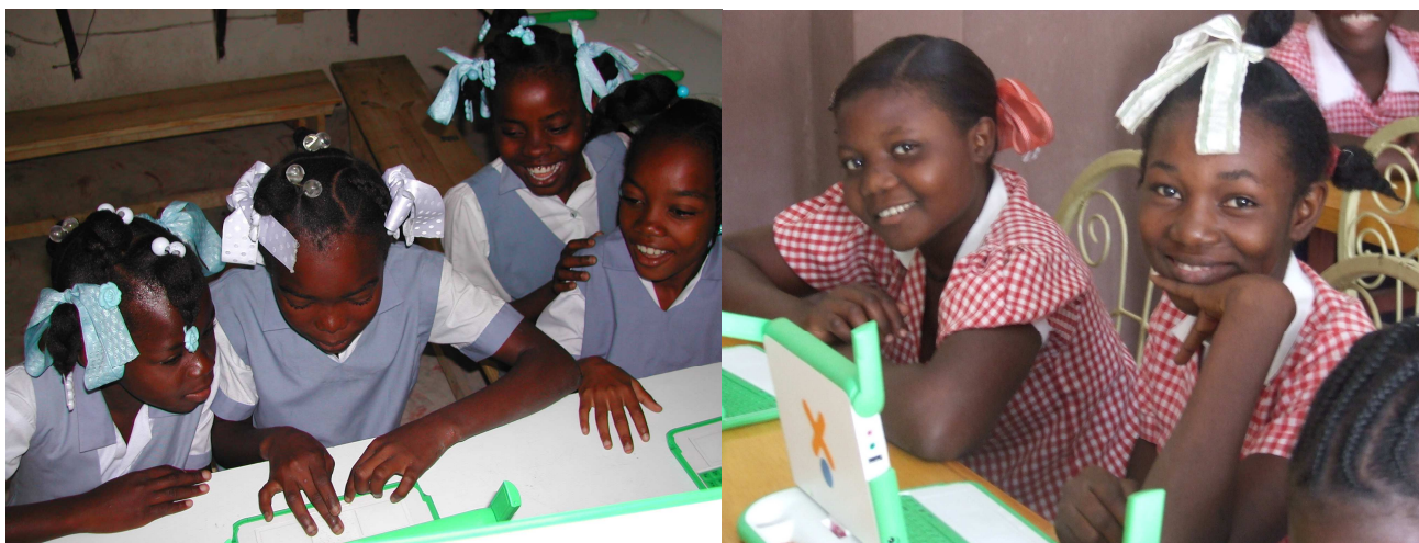
Élèves en Haïti

Les élèves ont particulièrement apprécié la possibilité d'utiliser les ordinateurs XO ainsi que la BSN qu'ils se sont très rapidement appropriés. Cette expérimentation a montré que la BSN est un outil pédagogique très pertinents pour les enfants et les enseignants et qu'il s'agit d'un projet favorisant l'éducation pour tous dans les pays en développement.